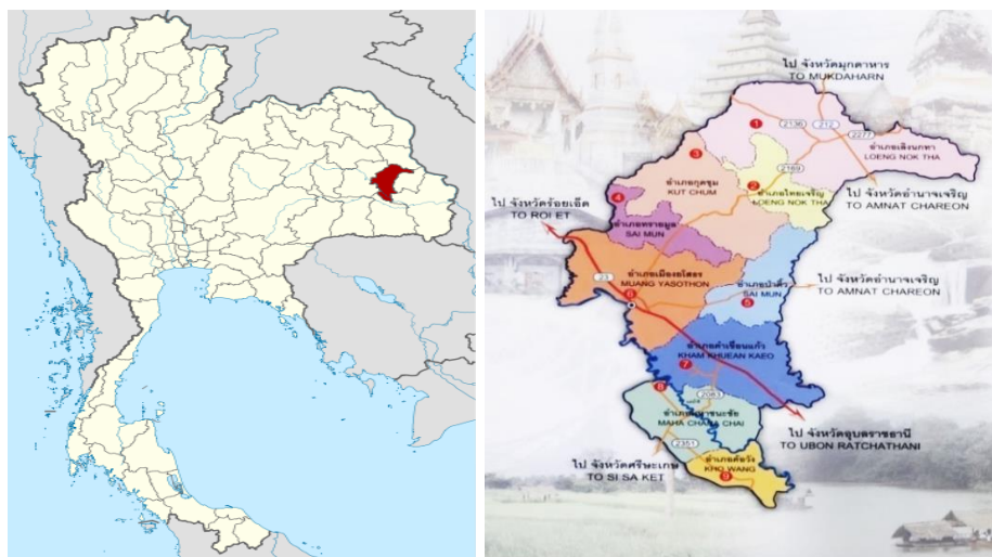
ภาพแสดงที่ตั้งและขอบเขตของจังหวัดโยโสธร