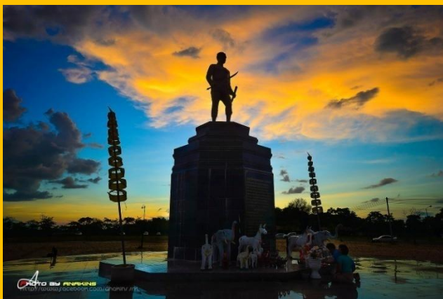
@ อนุสาวรีย์พระสุนทรราชวงศา