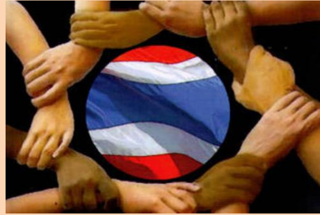
@ เมืองแห่งความสามัคคี ประองดอง