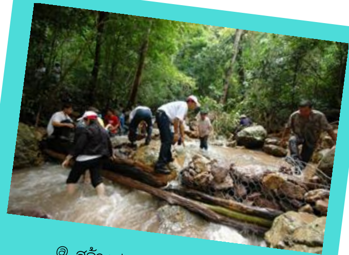
@ สร้างฝายชะลอน้ำ บ่อพวง

รณรงค์การปลูกต้นไม้ในวันเกิดเพิ่มพื้นที่สีเขียว ลดละเลิกการใช้สารเคมี สร้างฝายชะลอน้ำ บ่อพวง ตามแนวทางปิดทองหลังพระ