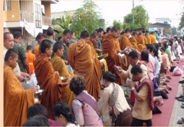
@ กิจกรรมตักบาตรช้อนยุคน