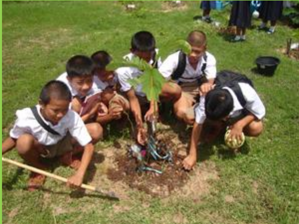
@ การปลูกต้นไม้ในวันเกิดตนเอง