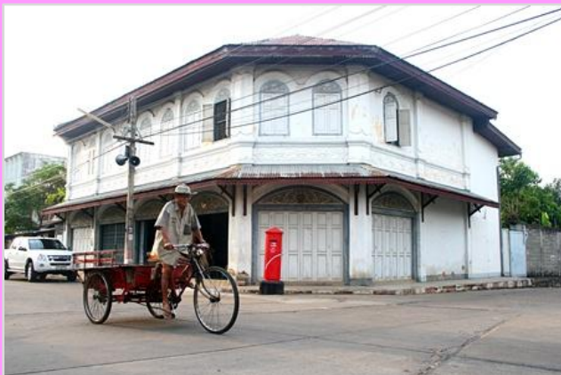
@ เมืองเก่าบ้านสิงห์ท่า