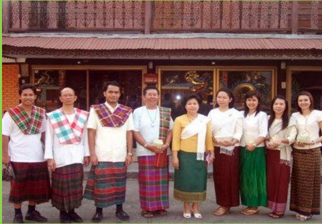
@ ประชาชนรักษาประเพณีที่ดีงาม