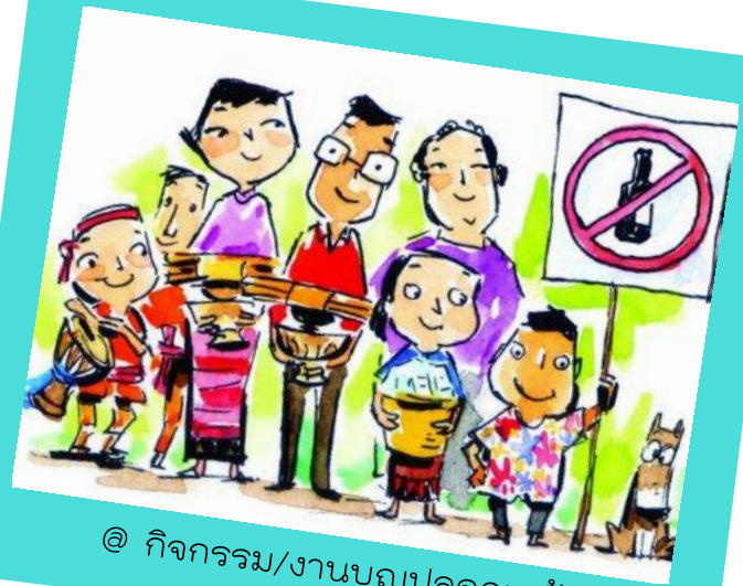
@ กิจกรรม/งานบุญปลอดเหล้า

ยโสธรเป็นเมืองที่ผู้คนยึดมั่น และมีการปฏิบัติตามหลักศาสนา การไปร่วมกิจกรรมในวันสำคัญทางศาสนา งานบุญปลอดเหล้า