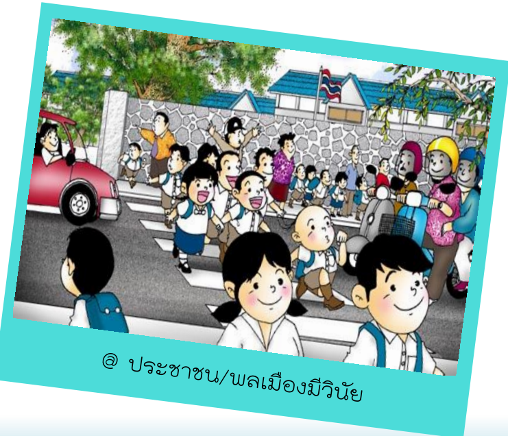
@ ประชาชน/พลเมืองมีวินัย