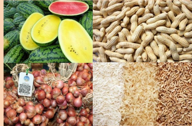
@ เมืองเกษตรอินทรีย์ (Organic City)