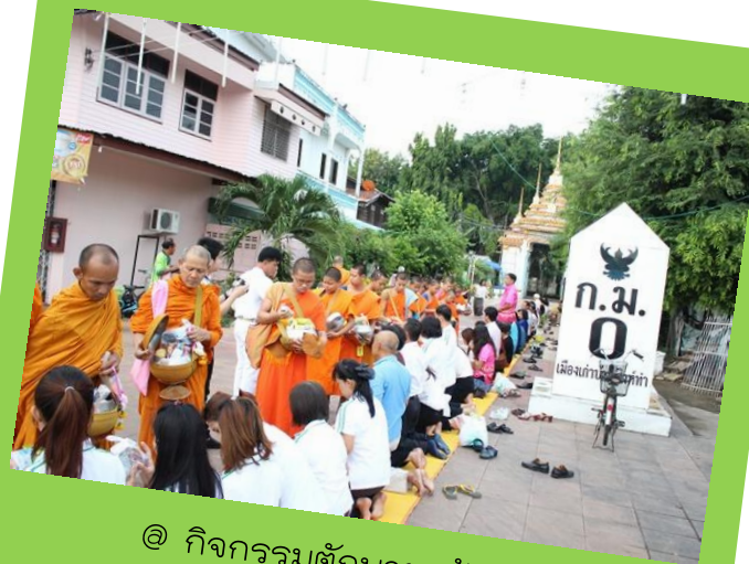
@ กิจกรรมตักบาตรย้อนยุค