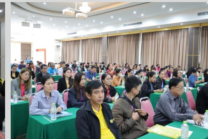
ยโสธรเมื่อเกษตรอินทรีย์ เมืองแห่งวิถีอีสาน